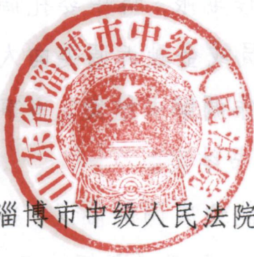
淄博市中级人民法院