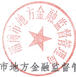
淄博市地方金融监督管理局